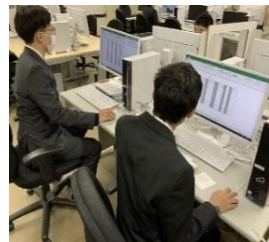
データ入力の実務訓練 (職業リハビリテーションセンター)