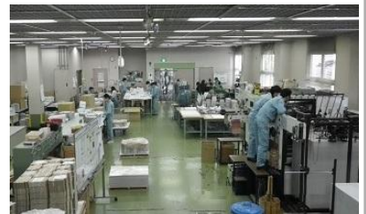
紙器作業室での訓練風景 (職業指導センター)