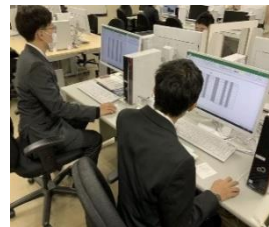
データ入力の実務訓練 (職業リハビリテーションセンター)