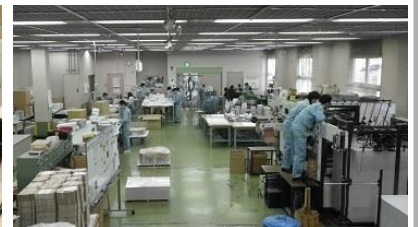
紙器作業室での訓練風景 (職業指導センター)